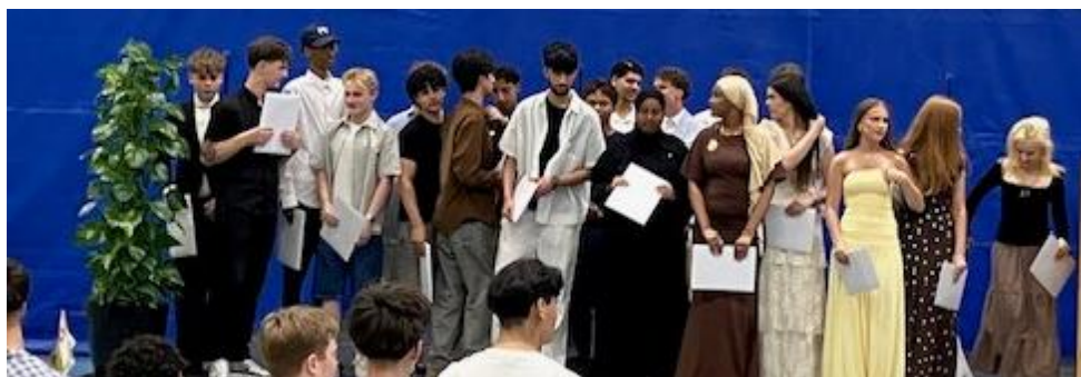
Translokation for 9.B Tillykke med afgangsbeviset fra folkeskolen 🇩🇰