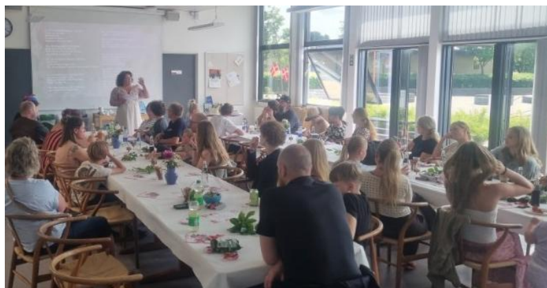
Translokation for 9.X Tillykke med afgangsbeviset fra folkeskolen 🇩🇰