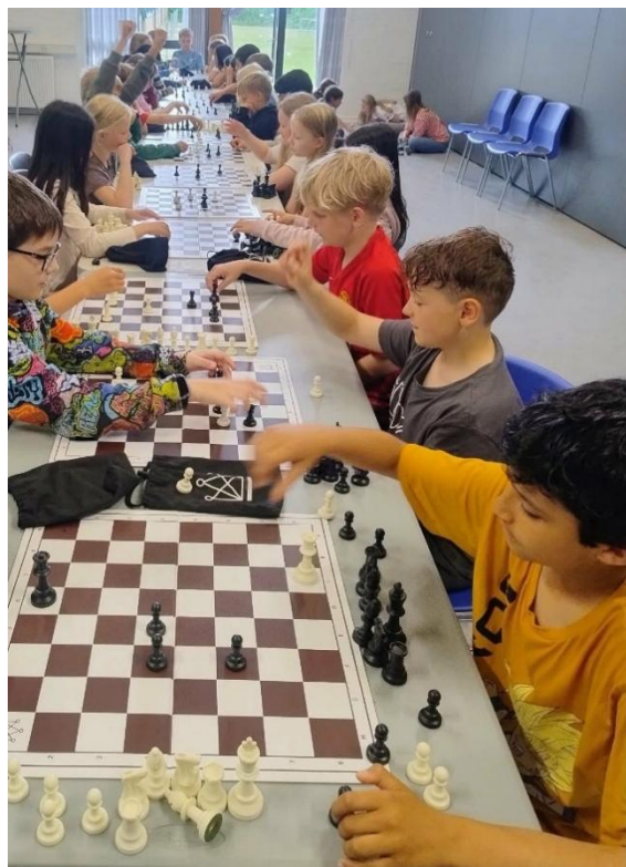
3. årgang, 5. B og mellemtrinet i Specialcenteret har haft besøg af Dansk Skoleskak