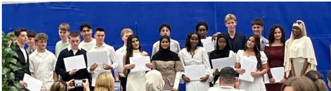
Translokation for 9.A Tillykke med afgangsbeviset fra folkeskolen 🇩🇰

Samtidig har I mulighed for at gense vores nye skolevideo om jer – og vores – lokale skole.